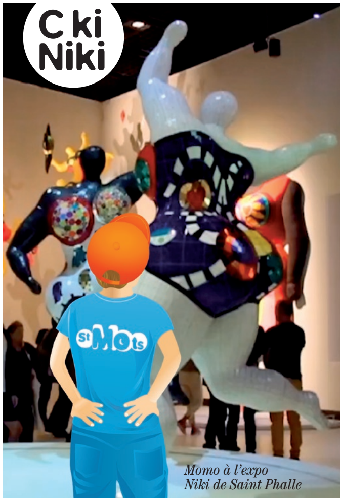
Momo à l'expo Niki de Saint Phalle